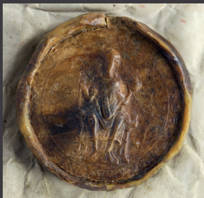
NLA WO, 25 Urk, Nr. 2

Für Ihre Anmeldung zu dieser Tagung (bis zum 5. September) oder für Rückfragen kontaktieren Sie uns bitte unter der E-Mail-Adresse: hist.komm@nla.niedersachsen.de oder unter einer der beiden Telefonnummern: 0511 120-6619 oder -6632.